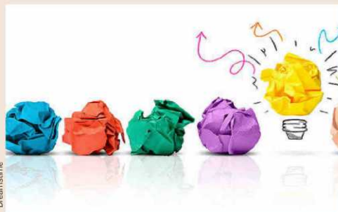
Tendrá lugar el fin de semana del 11 al 13 de marzo.

Este evento, que se celebrará en el Edificio I+D+i de la Usal, ya se ha realizado con éxito en ciudades como Londres, Berlín, Barcelona, Burgos o León, entre otros, y desde su implantación ha dado lugar a más de 23.000 equipos formados en 150 países a través de más de 3.000 eventos.