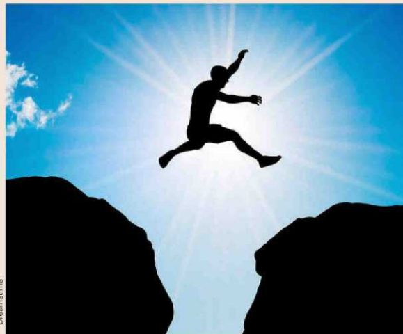
La inscripción está abierta hasta el próximo día 15 de marzo.

Para participar, los profesores deberán inscribir a sus alumnos en la página web de CompanyGame. La inscripción y participación es totalmen-